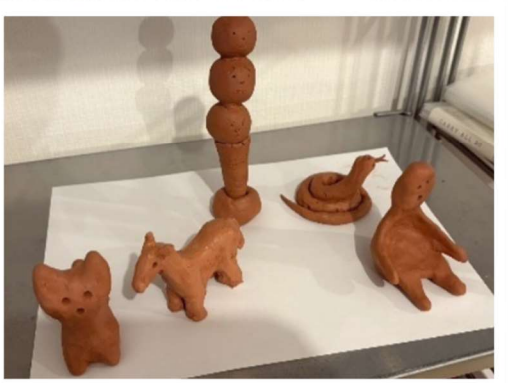
教え子らによる粘土作品