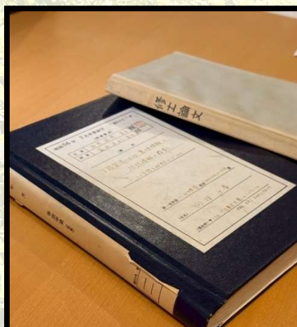
お宝その① 先生の卒論と修論