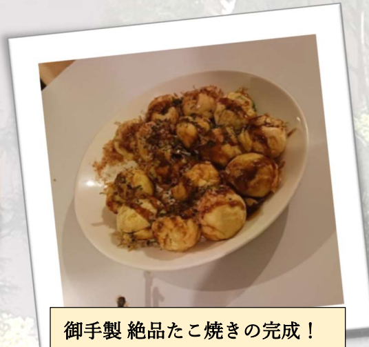
御手製 絶品たこ焼きの完成！